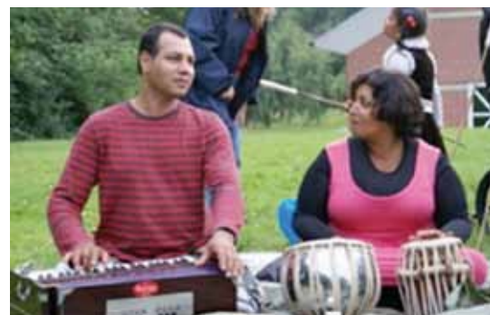
Et ægtepar fra Afghanistan spiller afghansk musik på sidste års sommerlejr.

For yderligere oplysninger eller tilmelding kontakt bethpadillo5@gmail.com eller ring 43 53 53 49 eller 30 45 04 14.