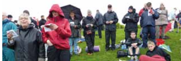
Men på Skamling øsede det ned ...!