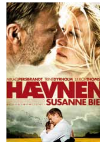
”Hævnen”, Instruktør Susanne Bier DVD kr. 180

Men filmens dilemmaer er jo eviggyldige og for mig er filmens morale: I den akademiske eller pædagogiske diskussion omkring volden og dens afarter ved vi godt, hvordan vi skal agere til efterfølgelse. I det virkelige liv – med kniven på struben – er alle muligheder åbne, på godt og ondt.