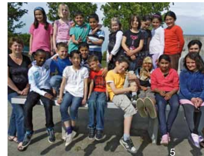
Årets heks er lavet af 3.b fra Munkevængets Skole