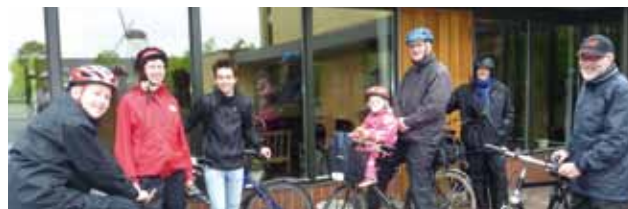
Det var vådt allerede fra begyndelsen ...

Selvom der er bustransport, fortsætter vi selvfølgelig også i år traditionen med at cykle 2. pinsedag. Alle cykel-entusiaster – i alderen 1 til 80 år – mødes derfor foran Simon Peters Kirke kl. 9.15. Vi vil have god tid til at nyde cykelturen ud til Kirkelunden. Husk mad og drikke til fælles fortæring i det grønne!