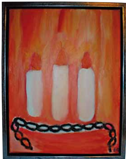
Maleri til jul: Lys med lænker, der er sat fri

Så er julen på vej, en velkommen tid til at samles som familier og venner rundt omkring bordene med dejlig mad, samles rundt omkring juletræerne og julelysene i hjemmene. Det er tid til at se lysets store værdier i mørke dage. Det er tid til at se frem mod nogle fridage fra det daglige arbejde og lære at nyde at være sammen med dem, man elsker. For dem, hvis familier bor langt væk, er julen også tid til at rejse for at være sammen med dem, man holder af på trods af store afstande. Julen er en velkommen tid til at gøre det, vi ikke gør til hverdag. Julen er en særlig tid, en tid til at udtrykke kærlighed, en tid til at give og til at modtage.