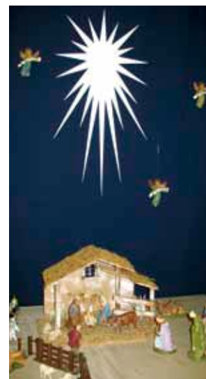
Simon Peters Kirkes julekrybbe skænket som gave i anledning af kirkens 25 års jubilæum

Læs her om en række vidt forskellige gudstjenester, som er åbne for enhver, der har lyst til at opleve en enkel og ligefrem formidling af, hvorfor vi fejrer advent og jul. Gudstjenesterne er altså ikke