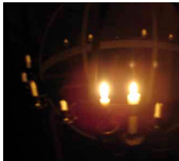
Lysgloben i Simon Peters Kirke en meditativ bibellæseaften i efteråret

Flere gange har jeg efter en hverdag med madpakker, job, møder, aftensmad, telefonsnak, kørsel med børn og mange flere hverdagsting været så træt og ikke orket at tage af sted. Men jeg er taget af sted alligevel og har været mere fyldt med fred og energi til livet, end da jeg kom. At dele tro og bøn med andre fylder mig med fred og kræfter. Det er mental udluftning.