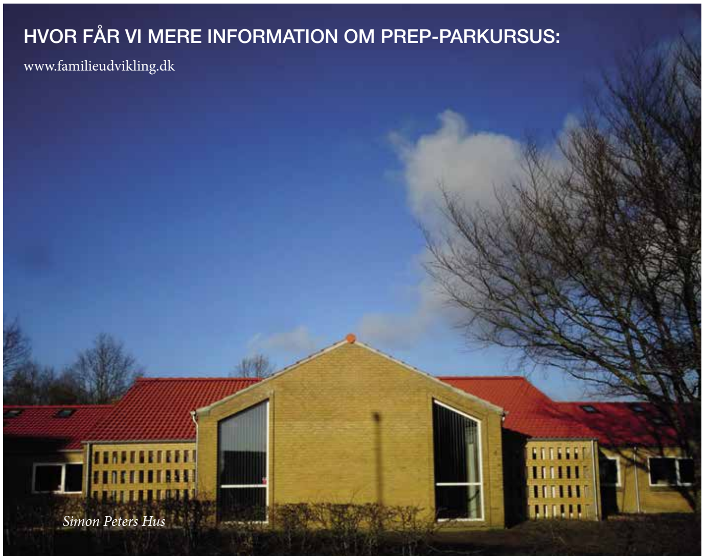
Simon Peters Hus